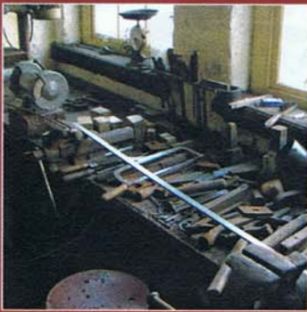
Gereedschappen van de Doornspijker smid Companjen