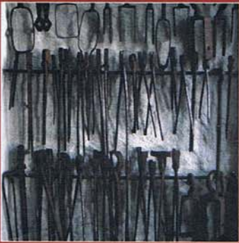
Nis met gereedschappen in 'De Hoefhamer'