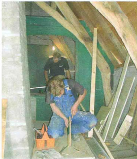
Medewerkers van DdB Aannemersbedrijf toveren een stoffige rommelzolder om tot tentoonstellingsruimte.

De dolman is het ceremoniële tenue van het korps Rijdende Artillerie, dat dateert van 1842. De toenmalige koning Willem II schonk het tenue aan het Korps voor verdiensten in de Slag bij Waterloo. Zelf nam hij, gekleed in dit tenue, aan de slag deel. Manschappen en onderofficieren hebben een gele dolman (vandaar Gele Ridders), officieren een goudkleurige. Het tenue is gebaseerd op een Hongaars cavalerie-uniform: het is een donkerblauwe, nauwsluitende huzarenbuis met gele of gouden tressen. Het hoofddeksel, de kolbak, is gemaakt van berenvacht en was oorspronkelijk bedoeld om tijdens het gevecht sabelhouwen op te vangen.