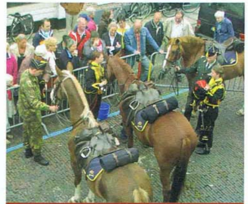
Drie paarden staan 'geparkeerd' voor de museumsmederij.

derden gegeven. Er is zoveel belangstelling voor deze cursussen dat er momenteel een wachtlijst van ca. vijftien personen is. In januari 2008 krijgt iedere belangstellende bericht over cursusmiddagen, – avonden en tijden en worden de nieuwe groepen cursisten samengesteld.