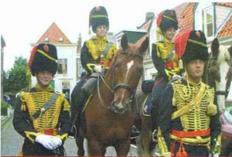
Fraai geüniformeerde Gele Rijders en Rijdsters poseren in de Smedestraat.

overvolle haven veel bekijks. Het beslaan van de paarden in de Smedestraat door hoefsmid Willem Veldkamp was – met name voor de vele jeugdige toeschouwers – spectaculair: De stichting was voor het eerst op de Bottermarkt aanwezig met een fraaie kraam, waarop allerlei gesmede producten waren tentoongesteld. De verkoop van met name onze vreugdewippers