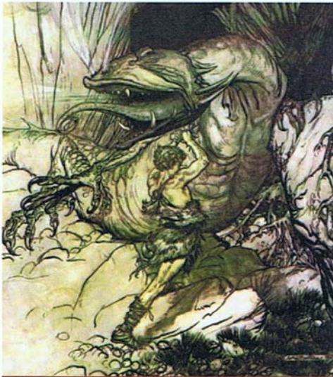
Siegfried doodt de draak Fafnir met het door hemzelf gesmede zwaard

Onlangs kreeg het bestuur een verzoek van de 'huurbaas', de Vereniging Hendrick de Keyser uit Amsterdam (HdK). Of we mee willen werken aan het muzikale evenement 'Honderd unieke concerten in honderd bijzondere panden'. Aanleiding is het feit dat het Nationaal Muziekinstrumenten Fonds (NMF) volgend jaar 25 jaar bestaat. Om dit te vieren is men van plan in 100 panden van HdK kamermuziekconcerten te organiseren, ook in onze museumsmederij! En of we bereid zijn in het weekend van 19 – 21 april 2013 ons pand beschikbaar te stellen voor een prachtig concert. Natuurlijk heeft het bestuur positief gereageerd en heel 'brutaal' ook een suggestie gedaan voor de uit te voeren muziek: een deel van de opera 'Il Trovatore' van Verdi of een deel van de opera 'Siegfried' van Wagner.