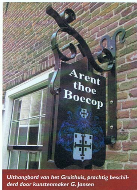
Uithangbord van het Gruithuis, prachtig beschil- derd door kunstenaar G. Jansen

Voor de middenstand is het uithangbord eeuwenlang een geliefd communicatiemiddel geweest, nodig om reclame te maken voor zijn nering. Immers, reclame is een vorm van communicatie met het doel potentiële klanten over te halen tot aanschaf van producten en diensten. En op die reclame-uitingen (borden, lichtbakken enz...) kan belasting worden geheven, de zgn. reclamebelasting. Ook in Elburg wordt op verzoek van de winkeliers deze nieuwe gemeentelijke belasting waarschijnlijk ingevoerd. Het is de bedoeling dat na aftrek van de gemeentelijke kosten de opbrengst van de reclamebelasting wordt gestort in een ondernemersfonds. En met dat fonds wil de middenstand o.a. meer evenementen organiseren. De hoogte van de bijdrage aan het fonds wordt bepaald door de WOZ-waarde (van het niet-woninggedeelte) van het pand. Dit geldt voor zo'n honderd panden in de binnenstad, ook voor de musea, dus ook voor museum- lees verder op de achterzijde