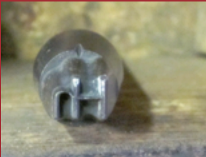
Het beeldmerk van De Hoefhamer: een combinatie van H en h.