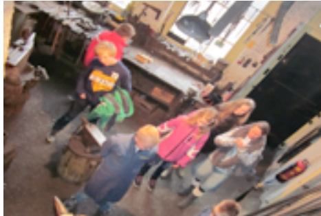
Leerlingen van de basisschool Mattanja uit de Hoge Enk in de oude werkplaats (2013)

Het bezoek van groepen aan De Hoefhamer neemt, zoals gezegd, hand over hand toe. Niet alleen de groepen 7 van bijna alle basisscholen uit de gemeente Elburg bezoeken in het kader van de zgn. Erfgoedleerlijn de smederij, ook basisscholen uit de gemeente Oldebroek weten de museumsmederij inmiddels te vinden. Daarnaast bezoeken leerlingen van het voorgezet onderwijs uit Elburg en Kampen de smederij, evenals het personeel van deze scholen. Maar ook deelnemers aan vrijgezellenfeesten, vrijwilligers van Wereldwinkels en hele families met een zgn. smederijverleden hameren er bij tijd en wijle lustig op los. Al met al brachten in de afgelopen maanden ruim dertig groepen een bezoek aan de museumsmederij. Dat dit veel drukte voor de ontvangende suppoosten met zich meebrengt, is duidelijk. Maar gelukkig ook de nodige pecunia voor de kas!