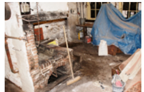
De situatie nadat de stofwolken waren opgetrokken. De schoonmaak kon beginnen.

Met de in gebruik name van de Zwolse klok is de herinrichting van de werkplaats op de begane grond afgesloten. Deze herinrichting was het gevolg van het broodnodige onderhoud dat onze huurbaas Hendrick de Keyser uit Amsterdam in januari jl. pleegde. Al langere tijd was namelijk in de gemetselde smidse en het rookkanaal veel en verontrustende scheurvorming waargenomen en in de bodem van de smidse was zelfs een gat ontstaan. In overleg is toen besloten dat dit hersteld moest worden, maar dat ook de muur boven het aanrechtje aan onderhoud toe was, evenals de oude, door houtworm aangetaste pijpenwals. En op verzoek van 'Elburg' is ook de derde nis in de zijmuur weer zichtbaar gemaakt.