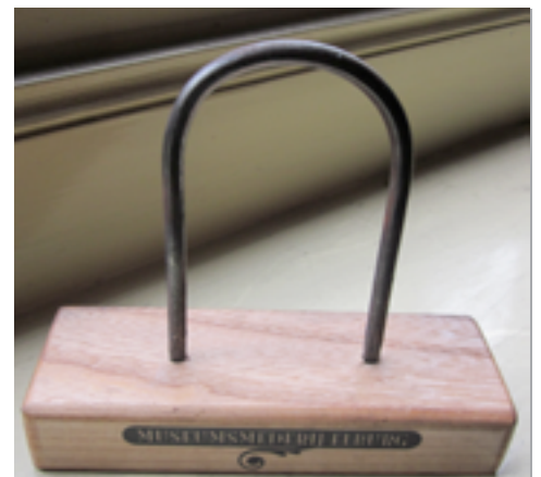
De mooiste gesmede kram wordt omgetoverd een heuse trofee.