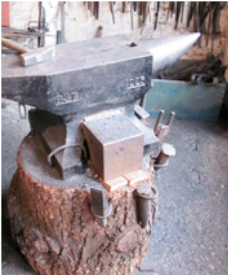
De 'Volvo' onder de aambeelden: het Kohlswa aambeeld met stuikijzer.

Toen de stofwolken waren opgetrokken begon de grote schoonmaak en herinrichting. Overbodige rommel verdween, kasten werden geruimd en fraaie schenkingen (zie Hoefhamer Nieuws 20) kregen een verdiend plaatsje in het vernieuwde interieur. Er verscheen een 'boekenkist' aan de wand met daarin zo'n vijftien titels zodat vrijwilligers en cursisten zich kunnen verdiepen in de theorie van het oude smidsambacht. Daarnaast (letterlijk) een beeldscherm op waarop prachtige, instructieve 'smeed-filmpjes' zijn te bewonderen. Het bronzen beeld van de smid, de wagenwip aan het plafond en de nieuwe klok worden aangelicht middels spotjes. En als klap op de vuurpijl is er bij Smederij Averink in Apeldoorn een Zweeds Kohlswa aambeeld aangeschaft, de 'Volvo' onder de aambeelden! Tenslotte is nog vermeldenswaard dat we een eigen slagijzer hebben laten maken zodat het beeldmerk van De Hoefhamer op de gesmede producten kan worden aangebracht. Het bestuur hoopt dat dankzij al deze aanpassingen er tot in lengte van dagen met veel plezier in de museumsmederij gewerkt kan worden!