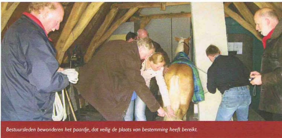
Bestuursleden bewonderen het paardje, dat veilig de plaats van bestemming heeft bereikt.

Inmiddels heeft het stichtingsbestuur de openingsdatum vastgesteld: vrijdag 27 juni a.s om 16.00 uur. Helaas kunnen we niet alle donateurs uitnodigen voor de opening want het is een heel interessante maar qua vloer-oppervlak kleine