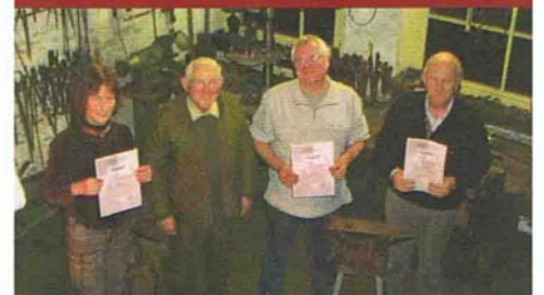
Cursusisten sept./dec. 2008 met diploma.