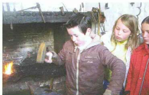
Leerlingen van groep 7 van Het Octaaf ijverig aan het smeden en zagen van een 'puntje'

Op 8 april jl. bezochten 26 leerlingen uit groep 7 van basisschool Het Octaaf in het kader van een project 'Techniek' de smederij. Vol enthousiasme stortten ze zich op het smeden van een 'puntje'. Na enige tijd gingen ze moe maar tevreden naar huis met hun gesmede punt, een roestig hoefijzer en (een enkeling) met brandblaren in de handen. Wanneer de tentoonstelling over het ambacht van de hoefsmid klaar is, is zo'n werkbezoek helemaal de moeite waard.