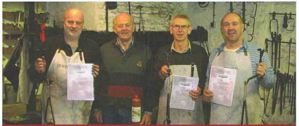
Geslaagden cursus sept./dec. 2007.

In Hoefhamer Nieuws Nr. 5 is er al even op gewezen: een tentoonstelling op zolder is