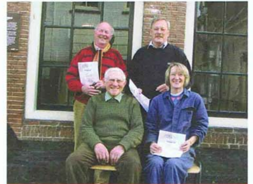
Gediplomeerde cursisten jan./ april 2008.

Tot slot nieuws over de cursussen. Die verlopen naar wens. Opvallend is dat de cursisten niet alleen uit Elburg komen maar ook van elders: