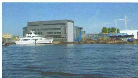
De nieuwe hal van Scheepswerf balk Urk Bv in Urk.