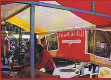
De fraai aangeklede kraam tijdens de Bottermarkt 2009.

Hoefhamer Nieuwsbrief • Behoud laatste smederij Elburg! • December 2009, nr. 11, jaargang 4