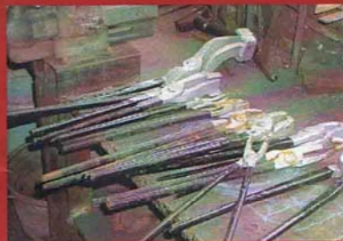
De bijzondere smeedtangen van het Nederlands Wegenbouwmuseum te Harderwijk.

De Hoefhamer wordt gesponsord door: Reclamebureau Kuiper & Company Antoine Kaldenbach Grafische Producties Scheepswerf Balk Urk BV Trailerbouw Elburg BV