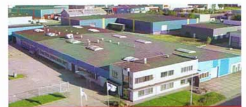
De fabriekscampus van Mustad Friesland te Drachten.

Patiënten die een CABG oftewel by pass operatie ondergaan, worden tegenwoordig als het even kan 'aan het kloppende hart' geopereerd. Dus zonder dat een hart-longmachine de vitale functies overneemt. 'Off pump' heet dat in het medisch jargon. Om de chirurg rustig te kunnen laten werken, moet het hart worden gefixeerd, een deel van de hartspier wordt zoveel mogelijk vastgezet. De Rijksuniversiteit Groningen ontwikkelde al in 1996 een apparaatje dat door cardioloog dr. P. Boonstra in een artikel in de Volkskrant wordt omschreven als een 'klein metalen hoefijzertje'. Hoe kan het ook anders met een eeuw ervaring van plaatsgenoot C.V. Hoefijzerfabriek Werkman & Co achter de hand?