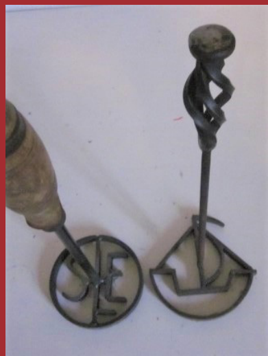
De door de SLE gebruikte brandijzers. Links SLE en rechts Schipluidenfonds