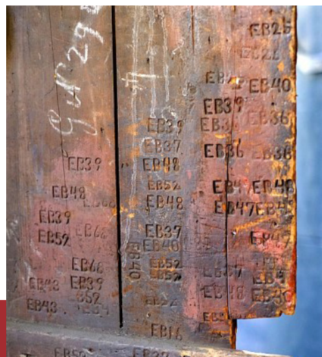
De 'plank' met de brandmerken van de De Gunsten

Onlangs werd het bestuur middels een mail met een aantal kritische opmerkingen geattendeerd op het feit dat het rode, houten schotje tussen werkbank en deur 'een bijzonder historische waarde heeft'. Naar de mening van een betrokken donateur/historicus is er in de afgelopen tijd wat al te slordig met 'deze plank' omgesprongen oftewel er zijn hier en daar schroeven in aangebracht. Wat is er zo bijzonder aan dit oude, houten luik? En weer citeren we de verontruste mailer: 'Immers, er zijn