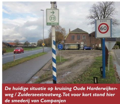
De huidige situatie op kruising Oude Harderwijkerweg / Zuiderzeestraatweg. Tot voor kort stond hier de smederij van Companjen

In nieuwsbrief 24 (nov. 2015) is nog uitgebreid geschreven over smederij Companjen in Doornspijk. Toentertijd konden bij het artikel ook nog recente foto's worden geplaatst. Dit is nu niet meer mogelijk want de smederij is gesloopt, de kruising Oude Harderwijkerweg / Zuiderzeestraatweg was onoverzichtelijk en gevaarlijk. Dat wordt nu allemaal aan huidige eisen aangepast maar daarmee is weer een vml. smederij verdwenen. In nieuwsbrief 2 (juli 2006) maakten we al melding van de sloop van de smederij van Pleiter in Oostendorp. Zo langzamerhand blijven er in de gemeente Elburg maar weinig smederijen over. In Doornspijk rest nog Smederij Wijnbergen aan de Zuiderzeestraatweg West. Deze smederij staat al in de ledenlijst van de B.S.C.M. (Bond van Smeden-, Constructie en Machinebedrijven) 1961/1962: Wed. J. Wijnbergen & Zn., Zuiderzeestr.weg 159 tel. 05258-261 Doornspijk. Helaas had de huidige smid geen tijd voor een kort interview maar wie weet komt dit later nog eens.